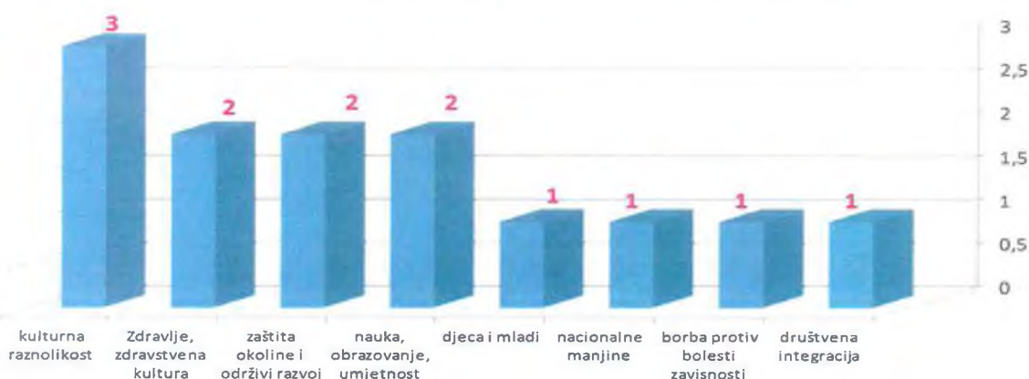
Broj dodijeljenih programskih grantova po tematskim oblastima

Od 13 dodijeljenih grantova najviše, njih tri se odnosi na tematsku oblast kulturna raznolikost i očuvanje tradicije. Po dva programska granta su namijenjena tematskim oblastima: zdravlje, zdravstvena kultura i zdravi stilovi života, zaštita okoline i održivi razvoj i nauka, umjetnost, obrazovanje. Na tematske oblasti djeca i mladi, nacionalne manjine, borba protiv bolesti zavisnosti i društvena integracija ranjivih kategorija društva odnosi se po jedan programski grant.