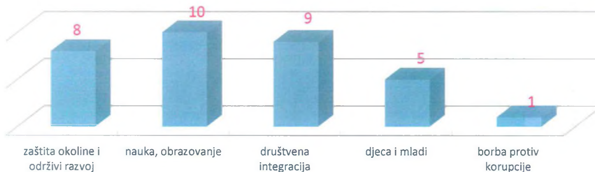
Broj dodijeljenih programskih grantova po tematskim oblastima

Od 33 dodijeljena granta deset se odnosi na tematsku oblast nauka i obrazovanje, devet na tematsku oblast društvena integracija, osam – zaštita okoline i održivi razvoj. Pet programskih grantova se odnosi na oblast djeca i mladi, dok je jedan grant posvećen borbi protiv korupcije.