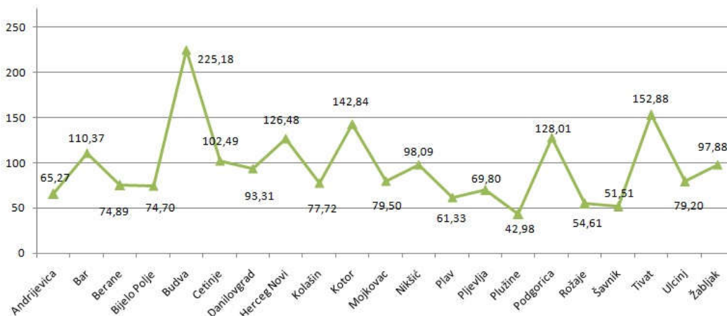
Grafik 2: Priključci platformi sa uslovnim pristupom u odnosu na broj domaćinstava – po opštinama

Međutim, podaci o broju priključaka pokazuju da je u Podgorici i nekim primorskim opštinama (Bar, Budva, Herceg Novi, Kotor i Tivat) broj priključaka značajno veći od broja domaćinstava, dok je u većem broju opština u sjevernoj regiji 1 broj priključaka oko 70% u odnosu na broj domaćinstava. Na osnovu navedenog se procjenjuje da približno 16.000 domaćinstava (oko 8%) još uvijek koristi samo besplatnu (Free to air) televiziju.