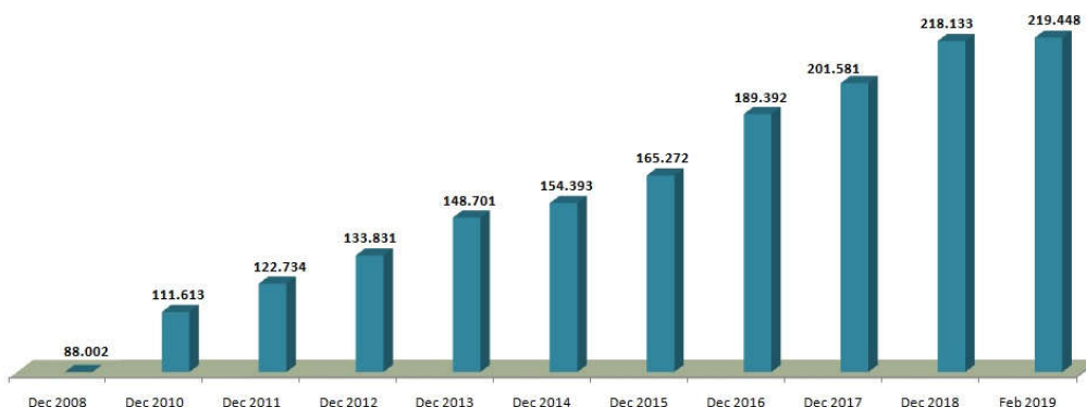
Grafik 1: Broj priključaka putem uslovnih platformi (Pay-TV)

U poređenju sa brojem priključaka na kraju decembra 2018. godine, za period od dva mjeseca, broj korisnika Pay-TV usluga je veći za 1.315 ili 0,60% .